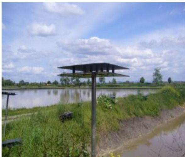
Dezodoryzacja na otwartych przestrzeniach. Fragment kurtyny żelowej – szereg statywów z żelem typu AIRHITONE IDRAGEL.

Preparat nie maskuje odorów, tylko poprzez wiązanie chemiczne eliminuje właściwości zapachowe cząsteczek odoroczynnych.