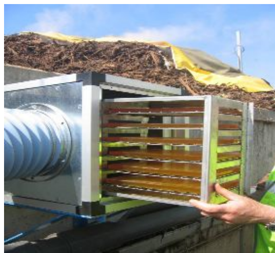
Wspomaganie dezodoryzacji w biofiltrach, żel typu AIRHITONE IDRAGEL